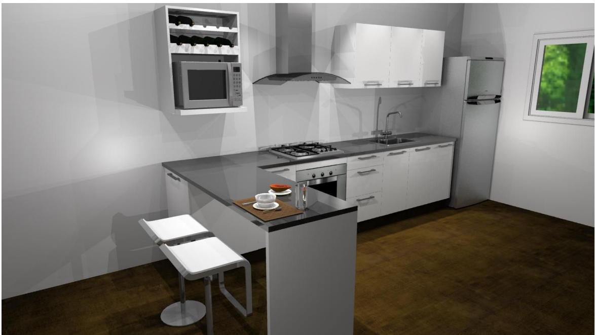
Pileta de doble baha de acero Jhonson y grifería de cocina monocomando línea "Swing" de FV.