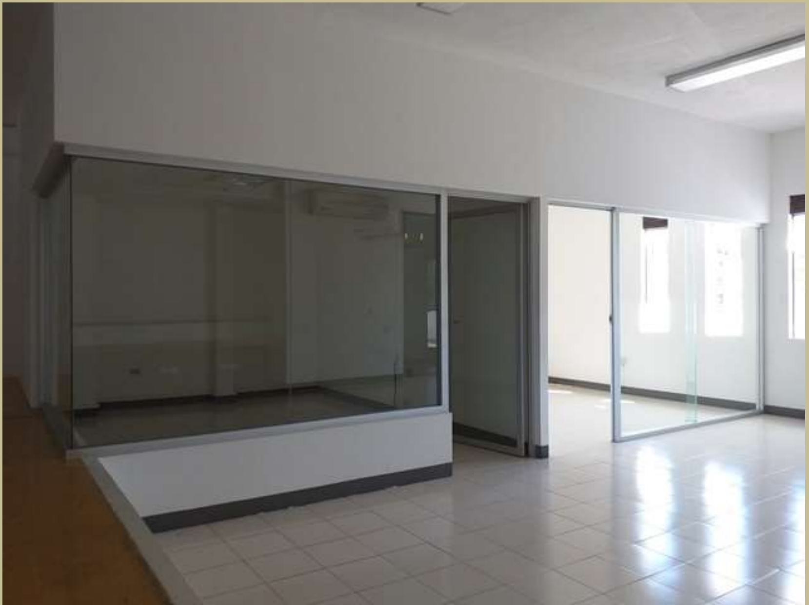
Oficinas Planta Alta