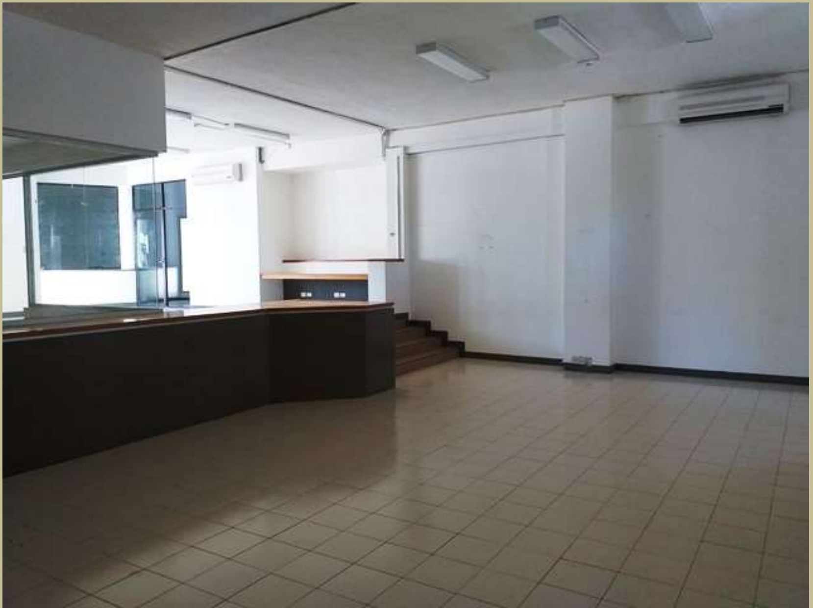
Oficinas Planta Alta