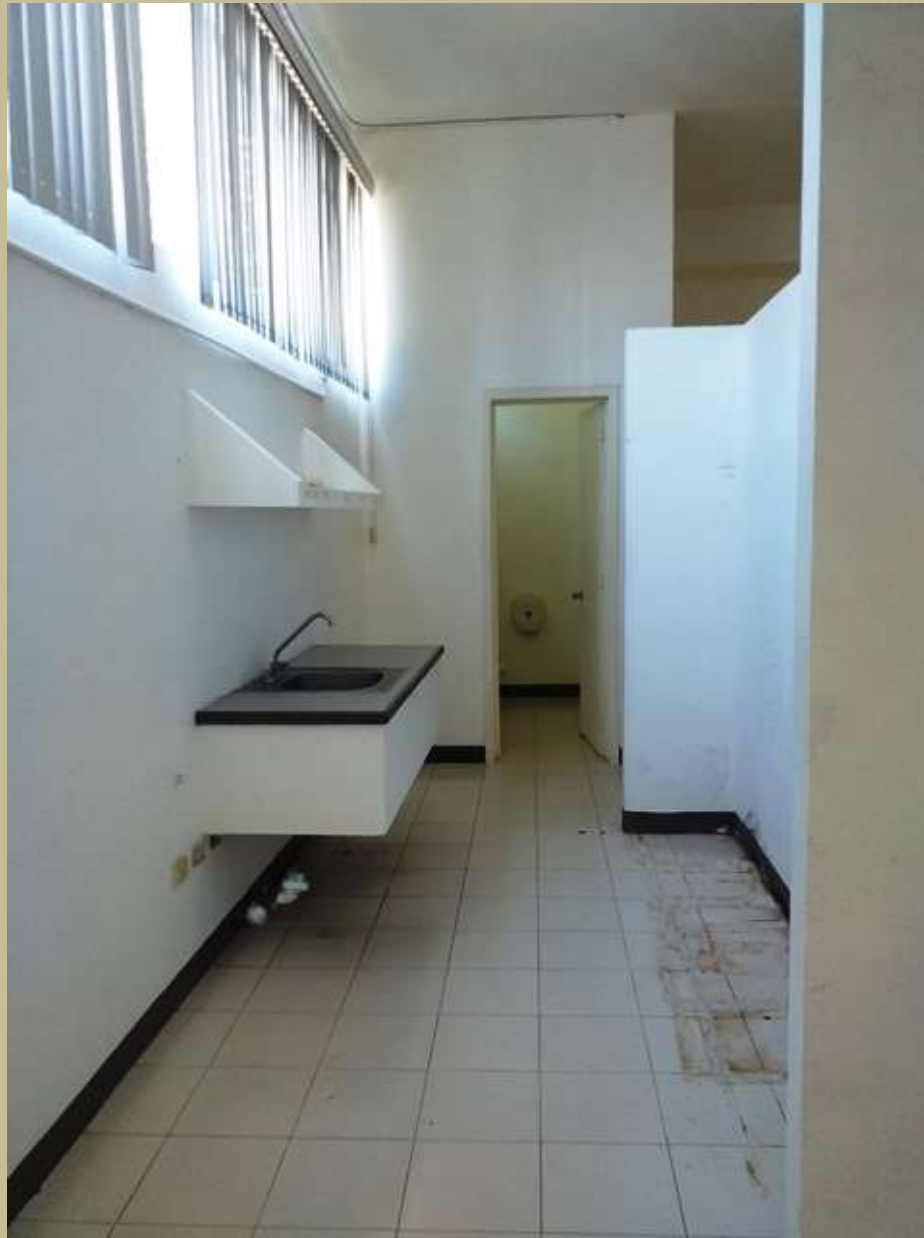
Barra con tarja