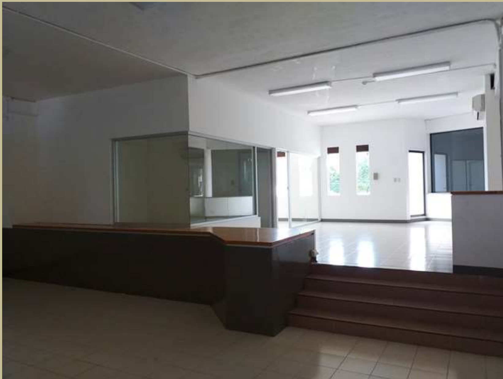
Oficinas Planta Alta