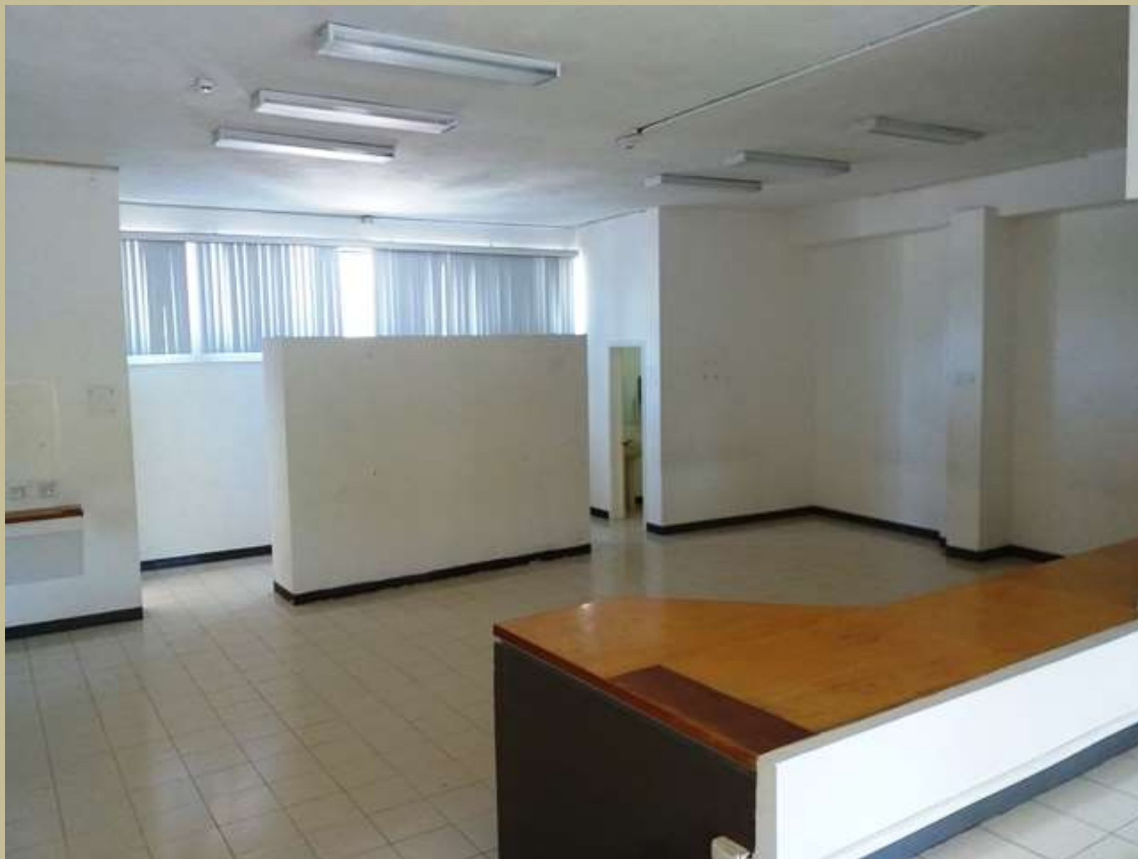
Oficinas Planta Alta