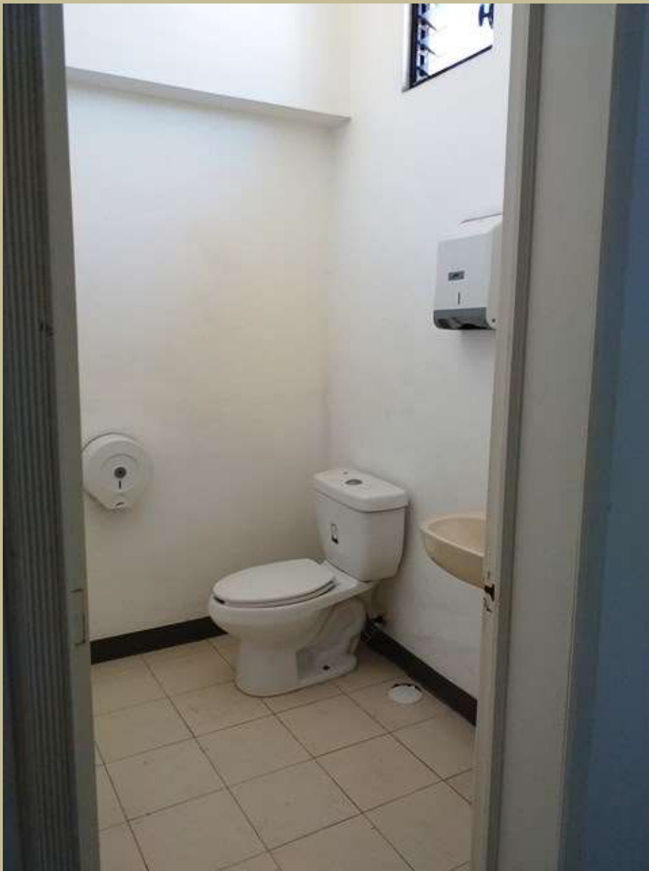
Baños en Planta Alta