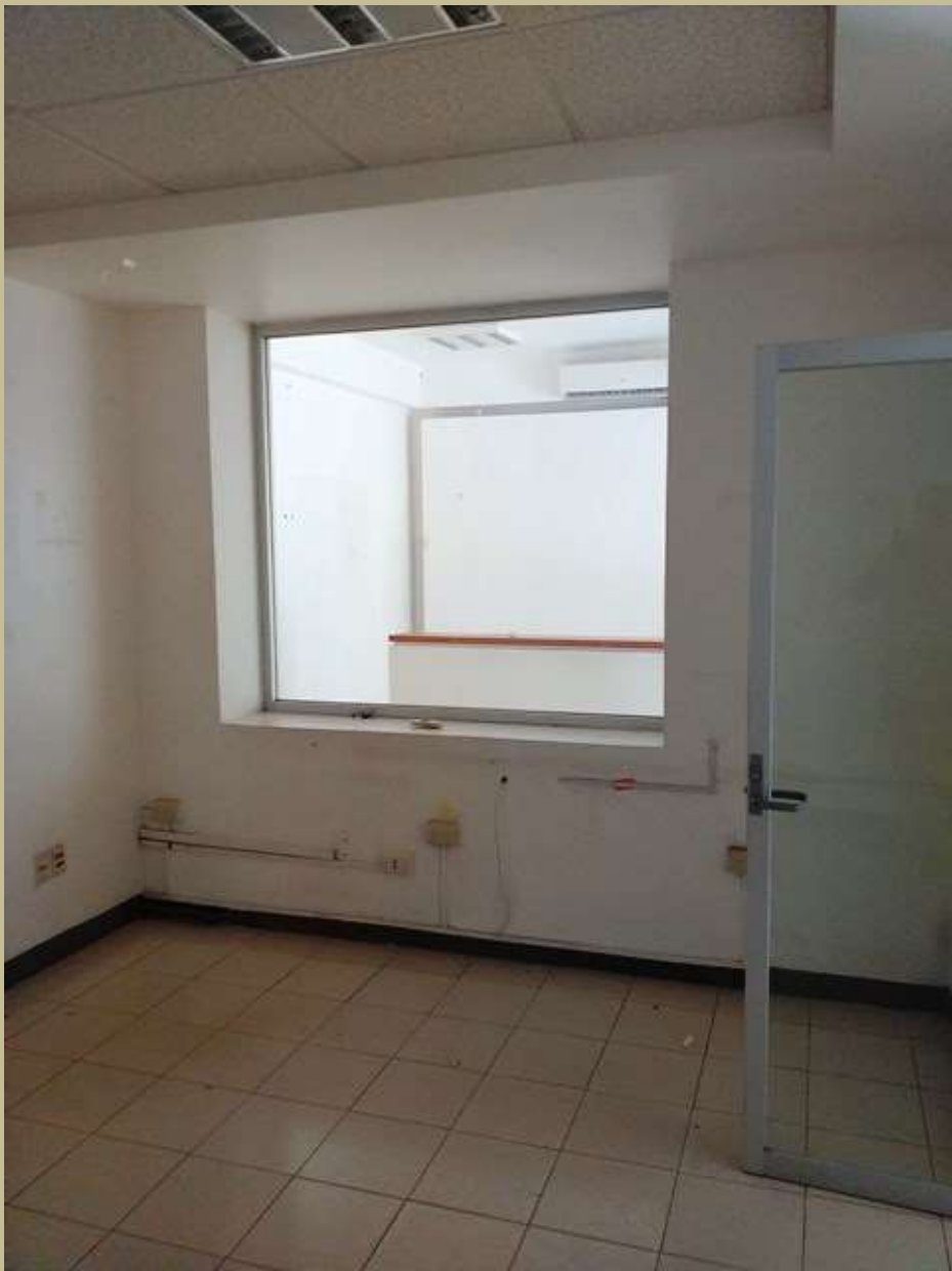
Oficinas Planta Baja