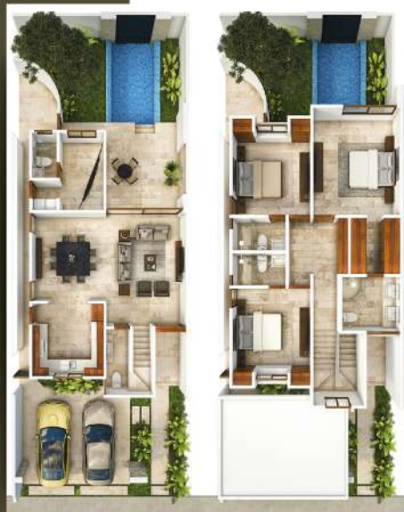
PLANTA MODELOS VENTO

Modelo LEVANTE no cuenta con balcon en recámara principal