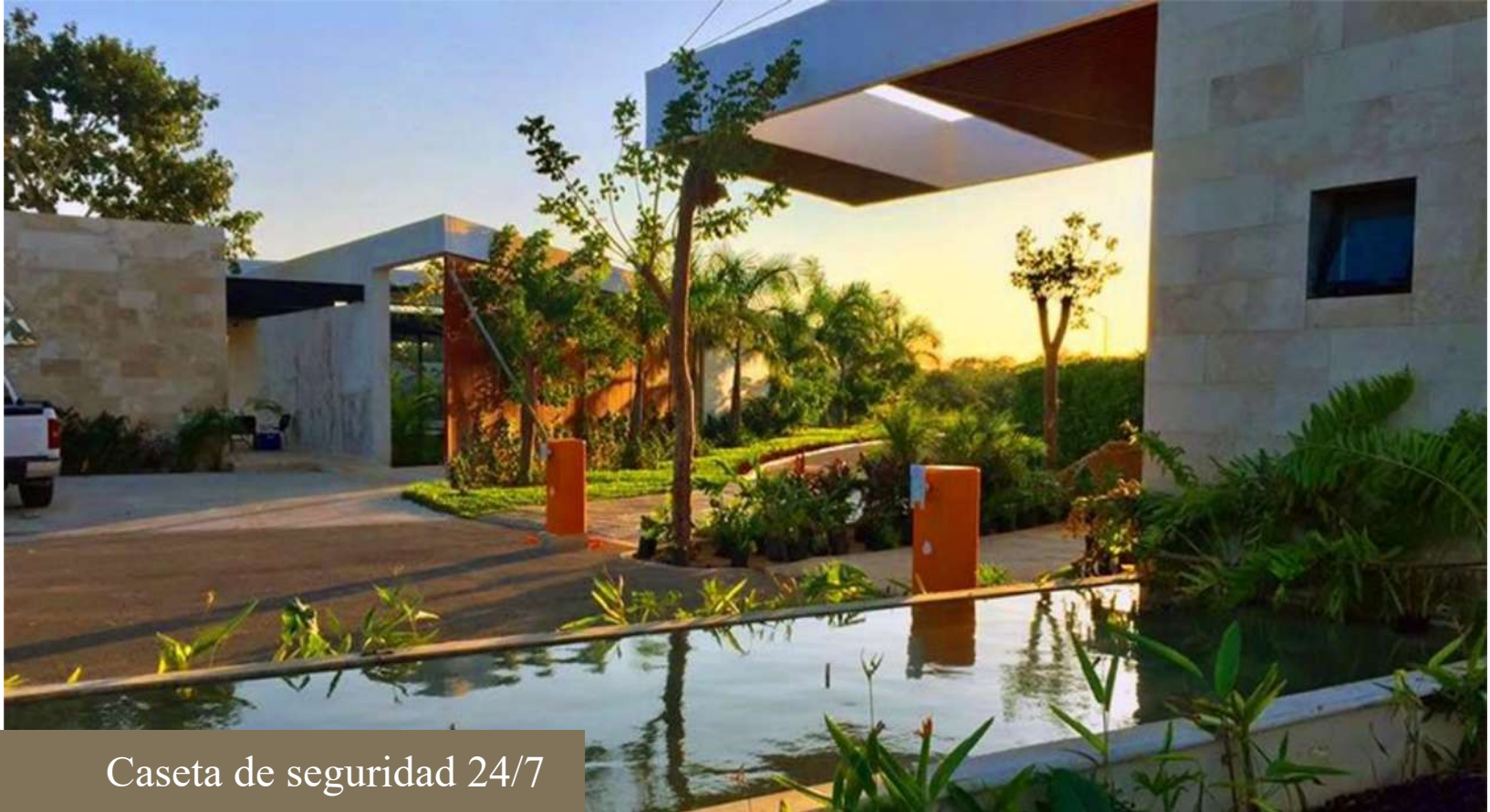
Caseta de seguridad 24/7